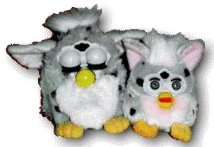
Furby et son petit frère: Furby Buddies

Si vous ne le nourrissez pas suffisamment, il commencera par vous ignorer en refusant de jouer avec vous, puis tombera malade (il éternuera et vous demandera de le soigner. Mais en le voyant cligner des yeux, remuant ses adorables oreilles et vous chantant une petite mélodie ou lorsqu'il imite