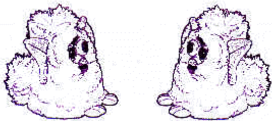
Place-nous face à face

Nous allons alors nous mettre à danser une de nos danses furbish et tu verra tous les moyens que nous avons de communiquer entre nous! Nous, Furbys, devons être en mesure de voir les autres Furbys pour communiquer entre nous. Pour ce faire, place-nous face à face et vérifie que nous soyons à moins d'un mètre l'un de l'autre.